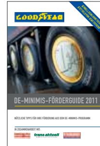
Booklet zu Spezialthemen