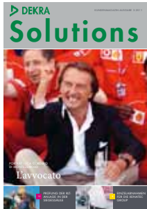
Das Magazin für die Kunden von DEKRA