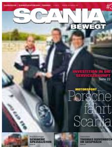
Das Magazin für die Kunden von Scania