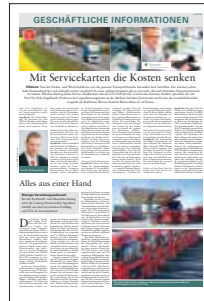
Unternehmen im Porträt