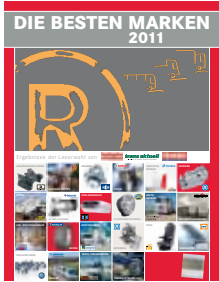
Firmen und ihre besten Marken