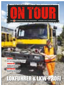
Das UTA Clubmagazin für den Fernfahrer