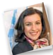
Dorothee Bär Parlamentarische Staatssekretärin im Bundesministerium für Verkehr und digitale Infrastruktur. Koordinatorin der Bundesregierung für Güterverkehr und Logistik

Ein informelles Get-together findet am 27. Mai abends im Restaurant CUBE in Stuttgart statt. Der Empfang beginnt um 18.30 Uhr, ab 19.30 Uhr gibt es einen Schlagabtausch zu aktuellen Themen mit der Logistik-Koordinatorin der Bundesregierung, Dorothee Bär.