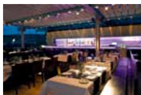
CUBE Restaurant Kleiner Schlossplatz 1 70173 Stuttgart